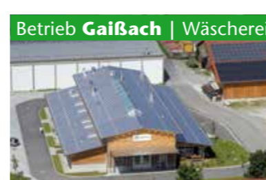
Betrieb Gaißach | Wäscherei